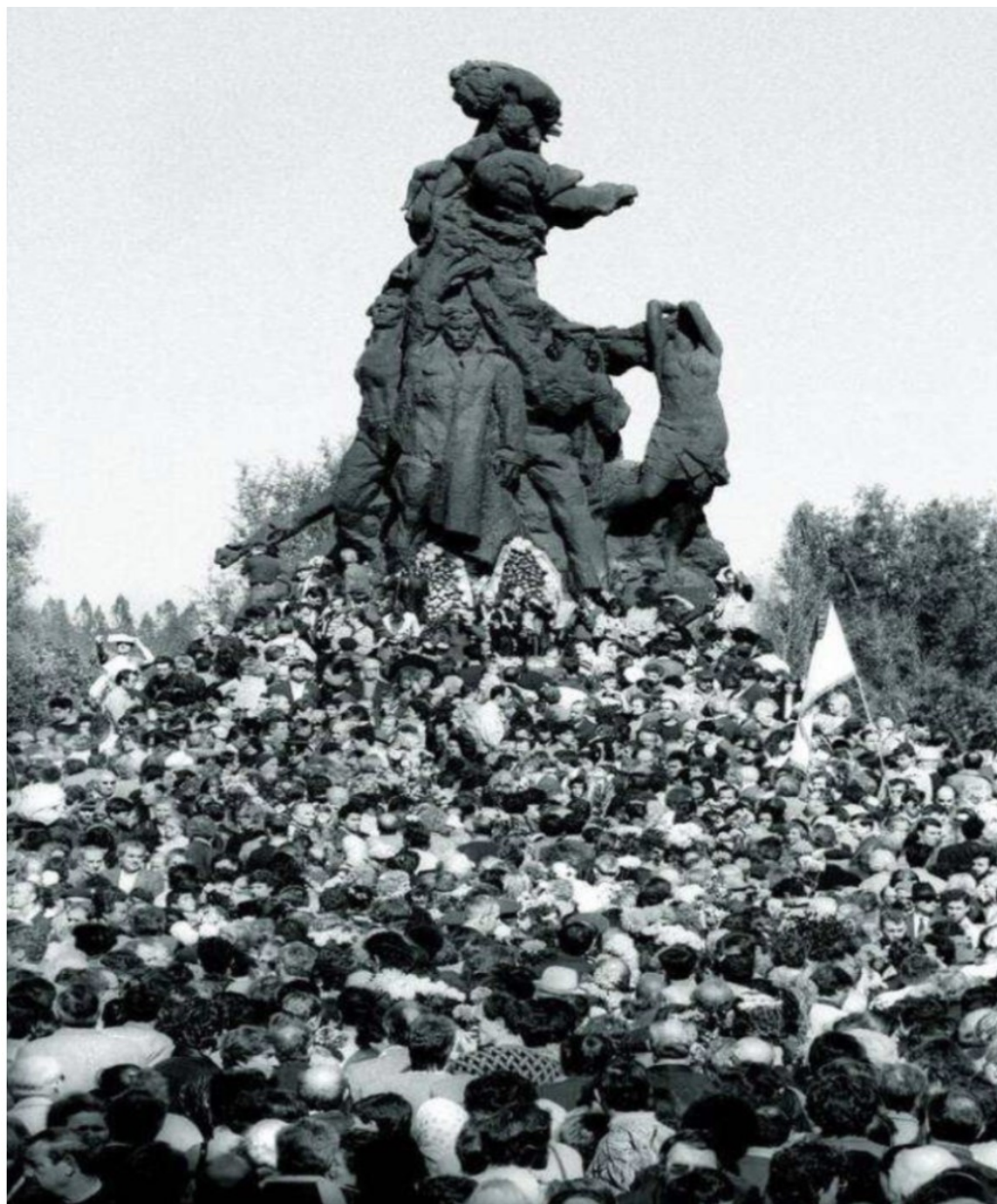
Sovjetiskt monument över fascismens offer i Babji Yar, Kiev (1976)