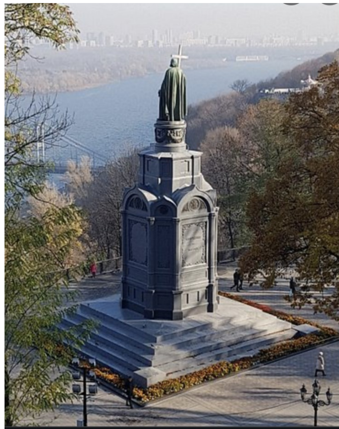
Vladimir I i Kiev (1853)