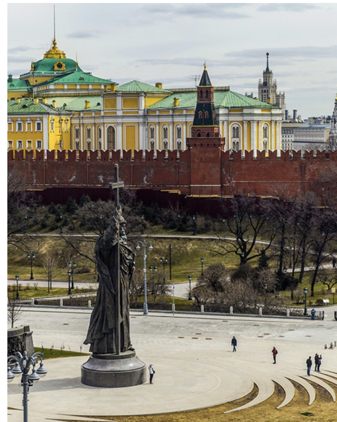
Vladimir I i Moskva (2016)