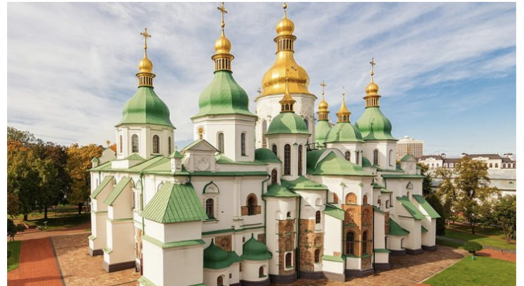
Saint Sophia Cathedral in Kyiv, Ukraine.

https://www.catholicworldreport.com/2022/03/01/impending-russian-attack-on-the-cathedral-of-holy-wisdom-in-kyiv/